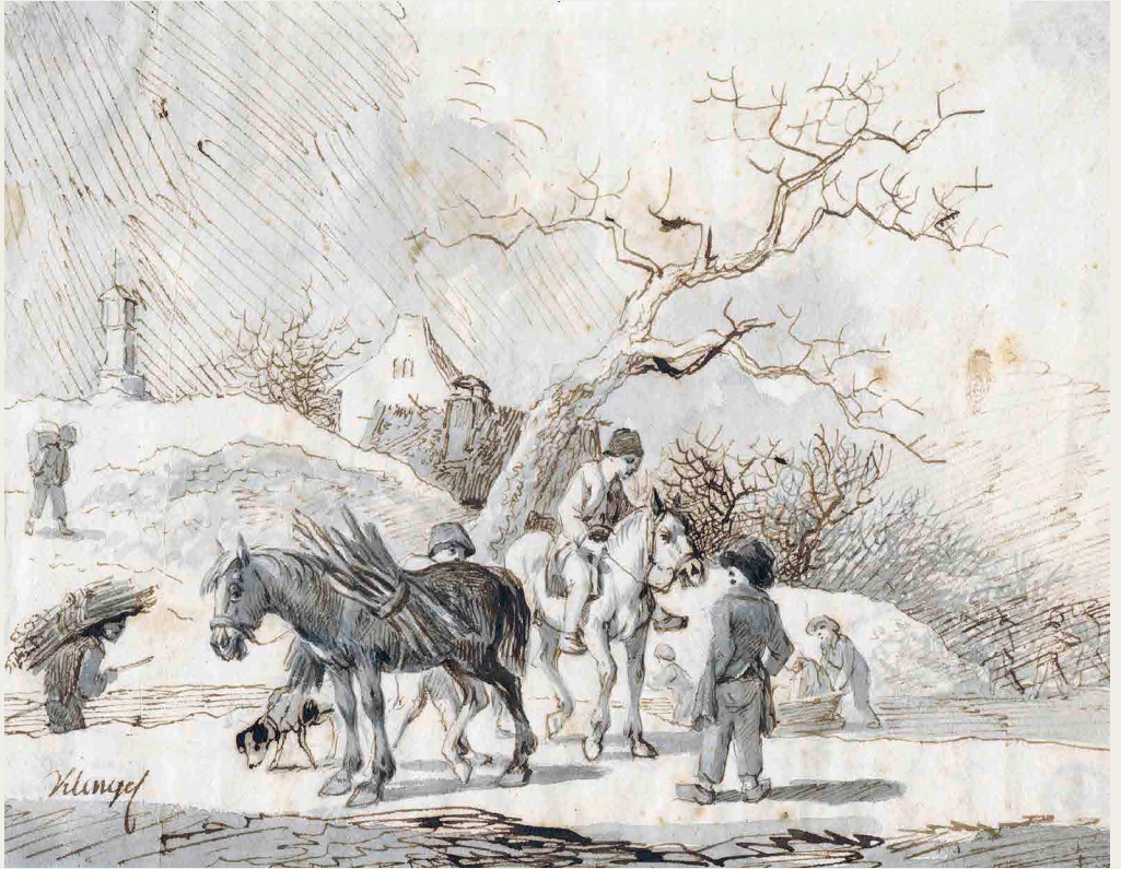
Johann Christian Klengel (1751–1824) Wintertag um 1800, Feder in Tusche und Pinsel in Wasserfarben