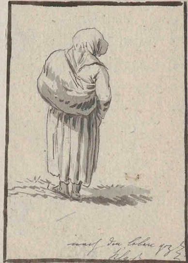
Friedrich Christian Klass (1752–1827) Figurenstudien um 1800, Feder in Tusche und Pinsel in Wasserfarben