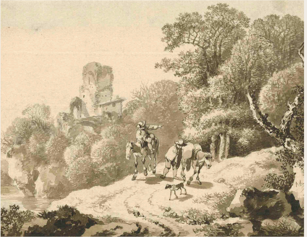
Johann Christian Klengel (1751–1824) Flusslandschaft mit einer antiken Ruine und zwei Reitern um 1790, Pinsel in Wasserfarben