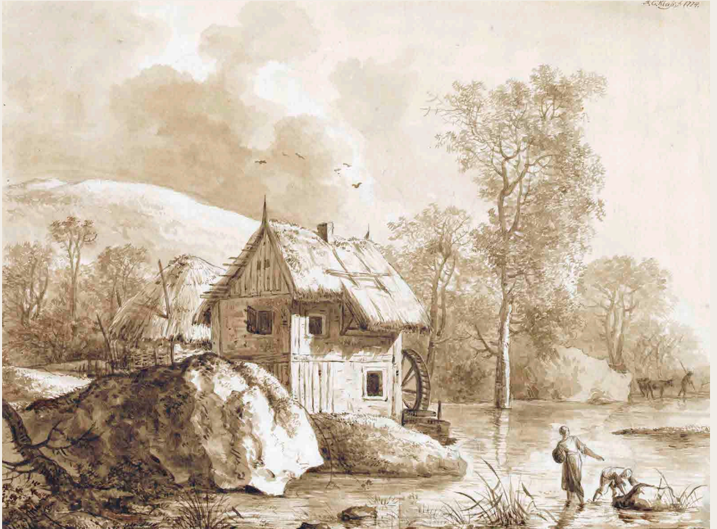
Friedrich Christian Klass (1752–1827) Flusslandschaft mit einer Wassermühle 1774, Pinsel in Wasserfarben über Grafit