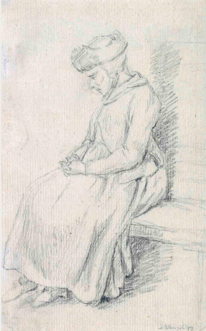
Johann Christian Klengel (1751–1824) Studie einer sitzenden alten Frau (die Großmutter des Künstlers) um 1780, Kreide