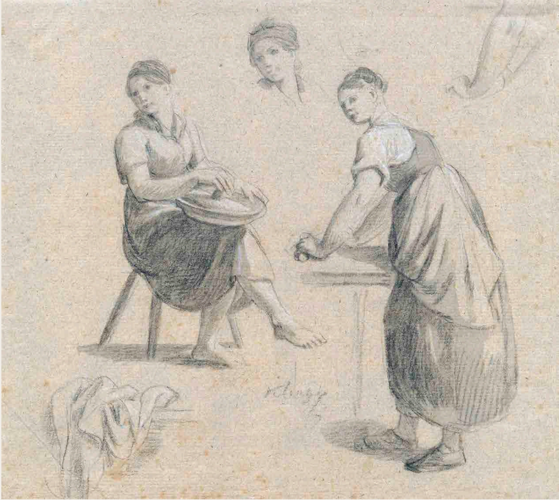
Johann Christian Klengel (1751–1824) Studien von zwei Mägden bei der Küchenarbeit um 1800, Kreide und Pinsel in Wasserfarben