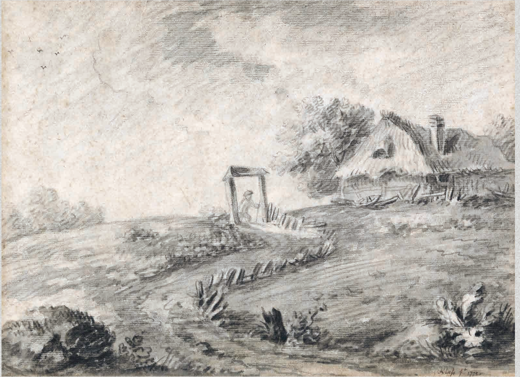
Friedrich Christian Klass (1752–1827) Weg zu einem Bauernhaus 1772, Kreide und Pinsel in Wasserfarben