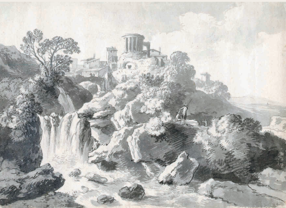
Johann Christian Klengel (1751–1824) Die Wasserfälle von Tivoli mit dem Tempel der Sibylle (nach Christian Wilhelm Ernst Dietrich) um 1775, Pinsel in Wasserfarben