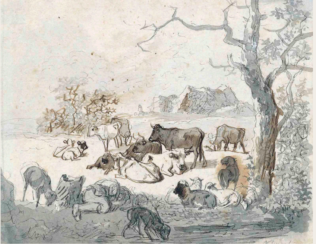
Johann Christian Klengel (1751–1824) Schafe und Rinder mit einem schlafenden Hirten um 1800, Feder in Tusche und Pinsel in Wasserfarben